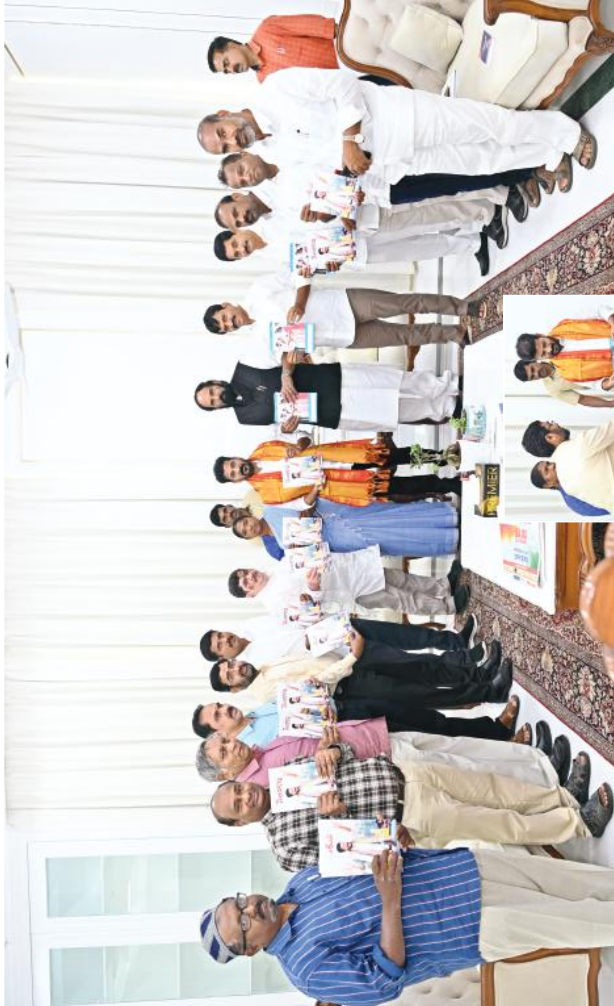
'తెలంగాణ మాసపత్రిక' జనవరి సంచికను సచివాలయంలో అధికారిణి ముఖ్యమంత్రి ఎ. రేచంత్ రెడ్డి, మంత్రులు, అధికారులు