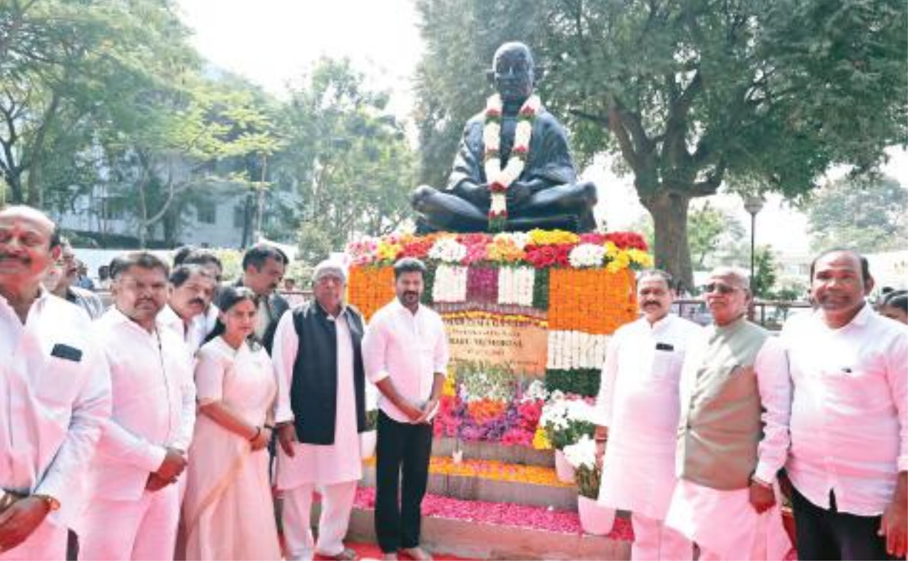
జాతిపిత మహాత్మాగాంధీ వర్ధంతి సందర్భంగా బాపూఘాట్‌లో నివాళులర్పిస్తున్న ముఖ్యమంత్రి ఎ. రేవంత్‌రెడ్డి, తదితరులు.